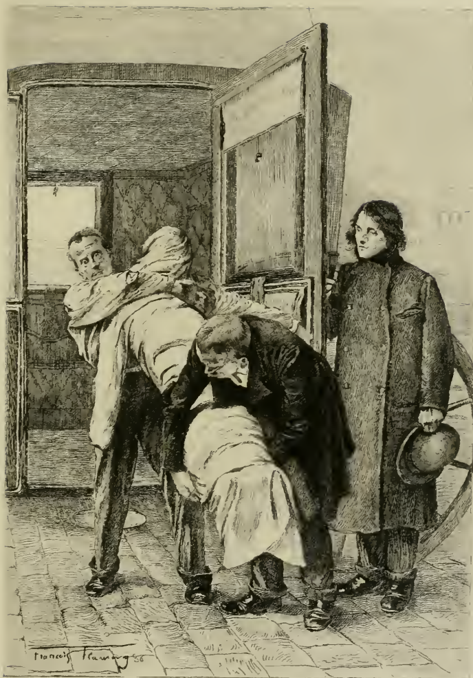
LE CADAVRE DE BAUDIN